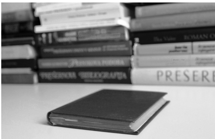
Drobna knjižica Prešernovih Poezij na ozadju obsežnega sekundarnega korpusa (fotografija Marijan Dovič)

Med temeljne vidike množenja sekundarnega korpusa sodi tudi prokreativnost . Zdi se, da je ravno sposobnost nenehne stimulacije novih derivativnih del ena izmed temeljnih potez umetniškega korpusa, ki se uspešno upira naravnemu procesu pozabljanja. Novi korpus neredko eksponentno preseže obseg primarnega: včasih le peščica kanoničnih pesmi (ali slik) zadošča za »prevod« v tisoče novih del najrazličnejših žanrov. Nova dela, ki so navdahnjena s primarnim korpusom, lahko s tem vzpostavljajo široko paletu medbesedilnih razmerij: bodisi slavijo izvorna dela in njihovega avtorja, imitirajo ali parodirajo njihov slog in vsebino, ali pa se enostavno naslonijo nanje v kreativnem, igrivem medbesedilnem stiku. Prokreativnost seveda ni omejena na izvorni žanr, jezik ali umetniški podsistem: literarno besedilo je na primer lahko uglasbeno kot instrumentalna skladba, prirejeno za zborovsko petje, upodobljeno kot slika ali kip; lahko postane temelj za opero, igro ali filmski scenarij oziroma nasploh na najrazličnejše načine spodbudi novo ustvarjalnost.