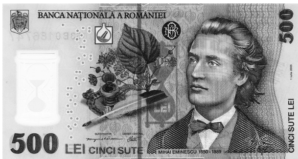
Romunski nacionalni pesnik Mihai Eminescu na bankovcu za 500 lejev iz leta 2005