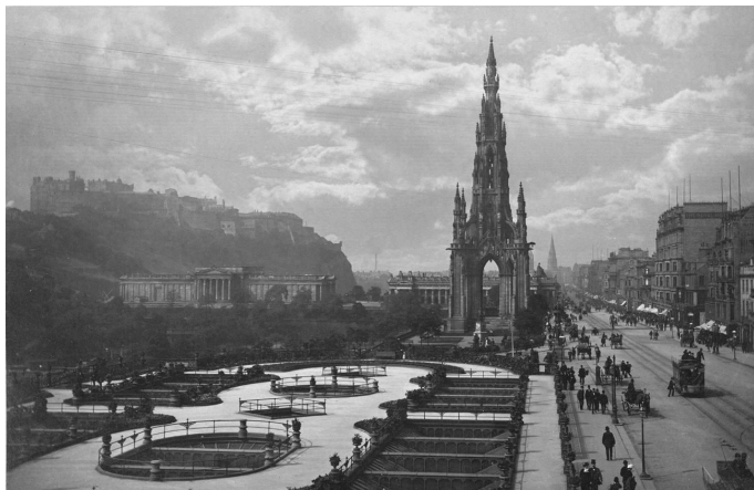
Spomenik Walterju Scottu, še danes verjetno najbolj megalomanski spomenik kakemu umetniku, 1844, Edinburgh, Škotska (neznani fotograf, okrog 1860)

objekti in spominske plošče, posvečene kulturnim svetnikom, postopoma oblikujejo gosto geografsko mrežo simbolno investiranih spominskih krajev, v marsičem podobno mreži krščanskih svetniških središč, ki so v srednjem veku prepredla Evropo. 17 Med njimi imajo osrednjo vlogo grobovi, (rojstne) hiše, ki so pri zvezdnikih svetovnega kanona postale viden ekonomsko-turistični dejavnik, 18 ter veliki javni spomeniki. Medtem ko so dotlej v spomin na umetnike (poleg nagrobnih spomenikov) postavljali predvsem biste in reliefe v interijerjih, so se zlasti po letu 1840 v evropskih mestih začeli epidemično množiti celopostavni kipi na bahavih podstavkih, ki so zavzemali osrednje urbane prostore. 19 Spomeniki in spominski kraji nastajajo še danes, a pri tem včasih privzemajo izrazito inovativne podobe (npr. potok v katalonskem Folguerolesu, ki je kanaliziran tako, da oblikuje podpis Jacinta Verdagerja).