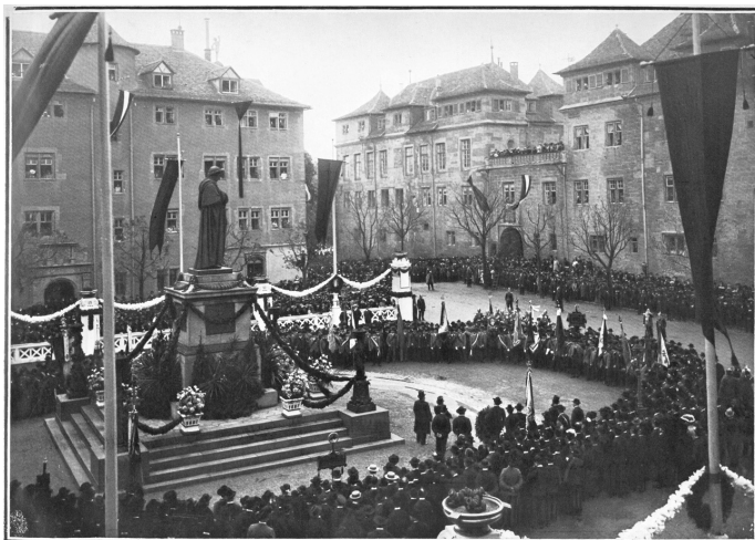
Množično praznovanje stoletnice smrti Friedricha Schillerja v Stuttgartu ob vznožju prvega velikega pesnikovega spomenika iz leta 1839, 1905

Kot smo že nakazali, je kanonizacija kulturnih svetnikov vidno zaznamovala tudi organizacijo (nacionalne) države s pomočjo prostorsko-časovnega označevanja . Kjer je nacionalni projekt napredoval v političnem smislu, se je na ozemlju (vzpostavljajoče se) države oblikovala mreža spominskih obeležij, ki je prepredla poprej »nedolžno« pokrajino z novim slojem asociacij in jo tako podvrgla (semiotični) nacionalizaciji. Kulturni svetniki resda niso bili vedno v prvi bojni vrsti takšnega osvajanja ozemlja (pogosto so pomembnejšo vlogo odigrali vladarji, politiki, vojskovodje, junaki ali revolucionarji), pa vendar so bili praviloma dejavno vključeni v proces. Pogosto – v primeru Boteva, Camõesa, Prešerna, Rosalíe de Castro in drugih – so bili uporabljeni tudi pri organizaciji specifičnega (sekularnega) koledarja. 31